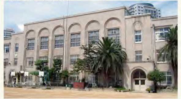
10/24長田南部まち歩き受付場所：JR新長田駅南側広場